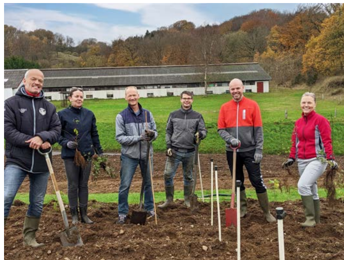
Plantedad på Stenagervænget - buske og træer erstatter græsarealer.

Skole, børneinstitutioner, kirke, forsamlingshuse, FDF Skibet, Skibet IF, Nr. Vilstrup forældregruppe og Skibet Makerspace indtil videre er med.