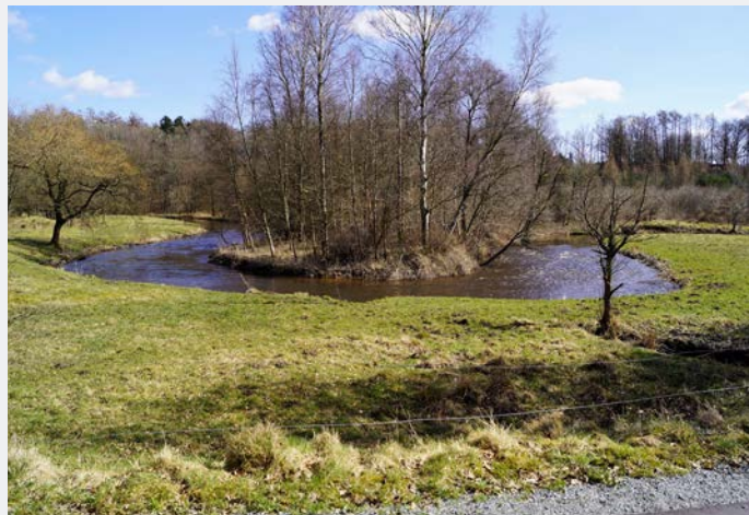
Morgenandagt efterfulgt af pilgrimsvandring i områdets skønne natur.