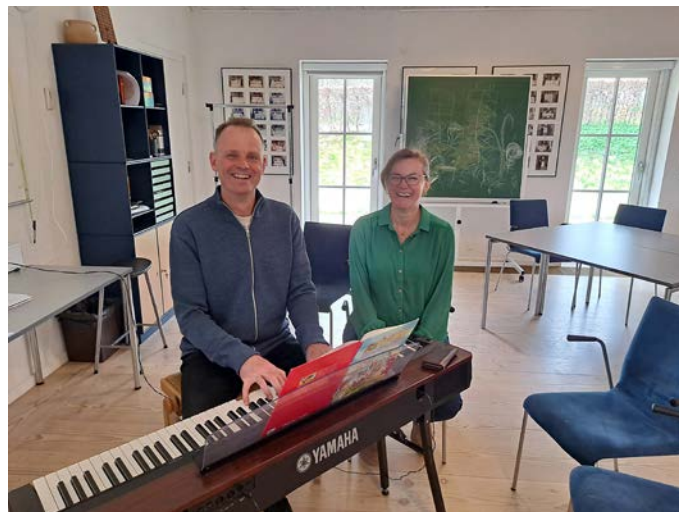
Mini-konfirmand starter igen 13.august.