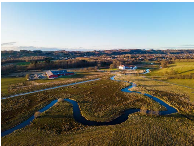
Smukt vue over vores skønne område.

Skibet og omegn er et af de smukkeste områder i Danmark og et fantastisk dejligt sted at bo. Vi ved, at naturen har en stor betydning for livskvaliteten og er en af de vigtigste grunde til, at folk så gerne vil bo i vores område. Vi ønsker derfor at passe godt på naturen, så vores område forbliver attraktivt og fortsat danner ramme for det gode liv.