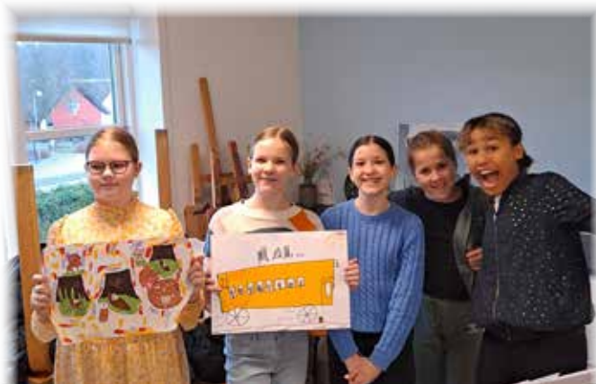
Juniorkoret i børnehaven.