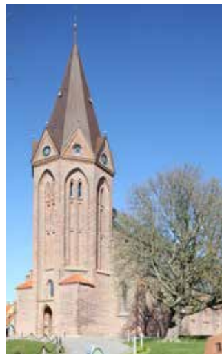
Vor Frue Kirke i Assens

Tilmelding sker efter "først til mølle" princippet.