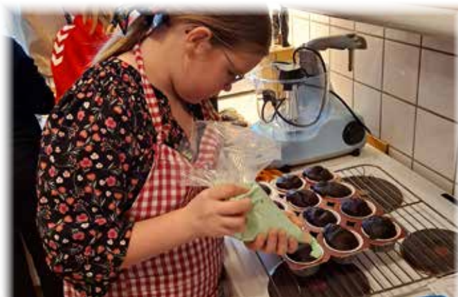
Bagedag med Juniorkoret.

Besøg i Skibet Børnehus, bagedag i Kirkehuset, julekoncert og højskolesang på plejehjemmet i Bredsten.