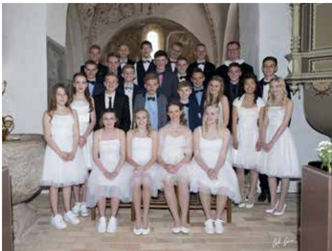
Konfirmander fra konfirmationerne St. Bededag den 1. maj 2015.

Følgende konfirmander konfirmeres i foråret 2015 i Skibet Kirke: