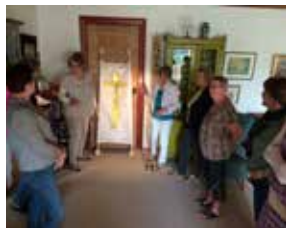
Alle detaljer i messehagelerne er blevet nøje vurderet særligt de fine kors, der er at finde på alle de fire hageler.