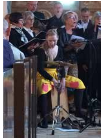
Det samme var kirkens personale!

Første korprøve efter sommerferien er d. 27 august. Optagelsesprøven ligger først i september.