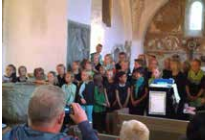
Spirekoret er for børn med masser af sangglæde!