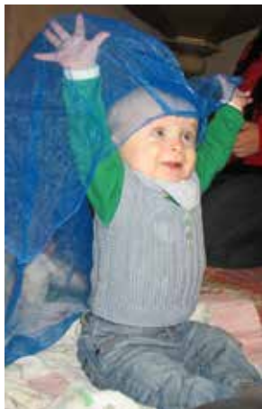
Nyt hold babysalmesang begynder den 12. august.

Vi begynder i kirken kl. 10, hvor vi synger, danser, vugger og laver fagter til sange og salmer. Vi bruger hele kirkerummet og hygger os med sæbebobler, tørklæder og musikinstrumenter.