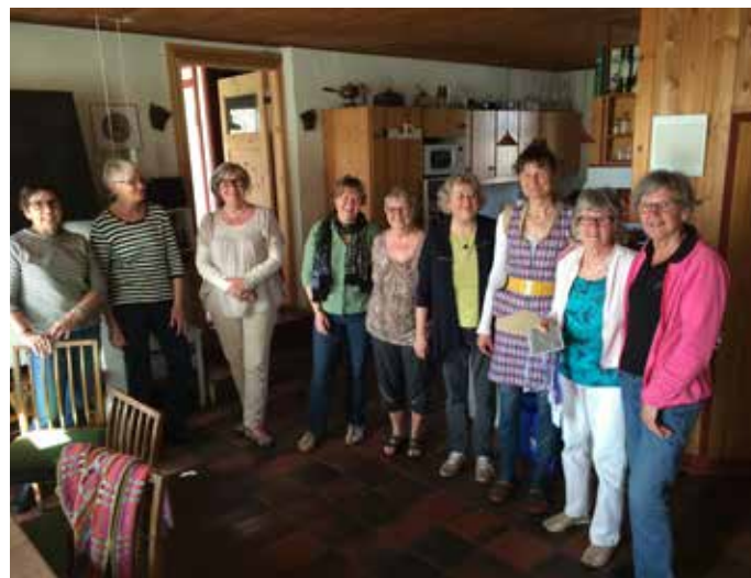
Pigerne mødes en gang om ugen for at sy på hagelerne – og samtidigt få en god snak og hygge lidt henover arbejdet.