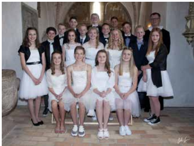
Konfirmander fra konfirmationerne lørdag den 2. maj 2015.